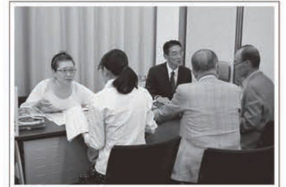
2014年度 助成団体合同説明会 個別質問会