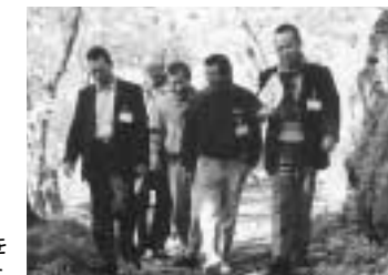
人と自然が共生できる街づくりをテーマに意見が交換されました。

昨年の手稲山に続き、定山溪温泉にて会議が開催されました。北海道内の環境をテーマに活動中の、ボランティア団体の各活動内容の相互理解と情報交換、定山溪の自然と共生した街づくりなどを目的とした会議で、活動報告や意見交換が活発に行われました。