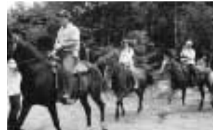
ホーストレッキング