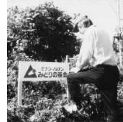
グリーンランドクラブちぶ(島根県) 知夫里島の自然を観察できるよう稀少植物のネームプレート等を作成。大山隠岐国立公園