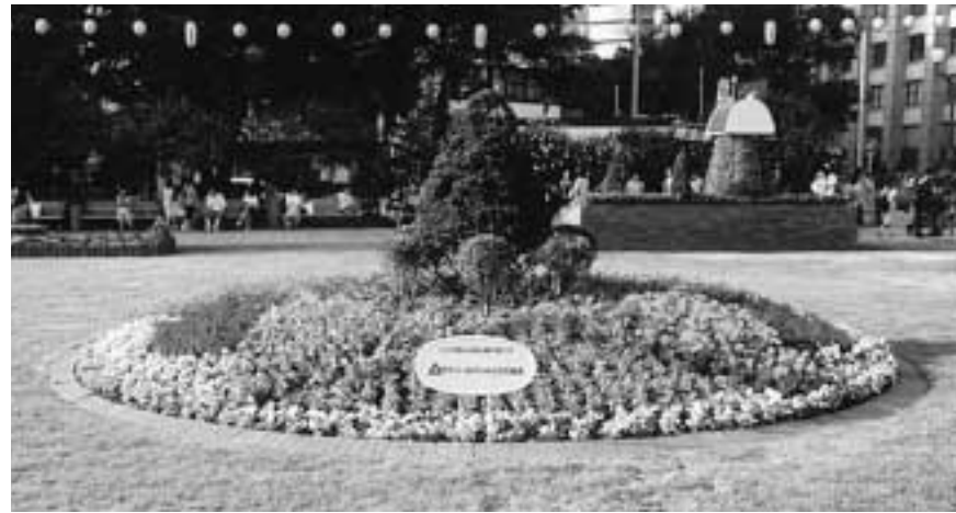
セブン-イレブンみどりの基金花壇は大通4丁目東側にあります。

平成9年度から出展し、年間を通じ維持管理している札幌大通り公園「セブン-イレブンみどりの基金」花壇。春はパンジー、夏はマリゴールドやペゴニア、サルビアなど色とりどりの花々が憩いの場所を彩り、札幌市民や観光客など公園を訪れる人々の目を楽せました。