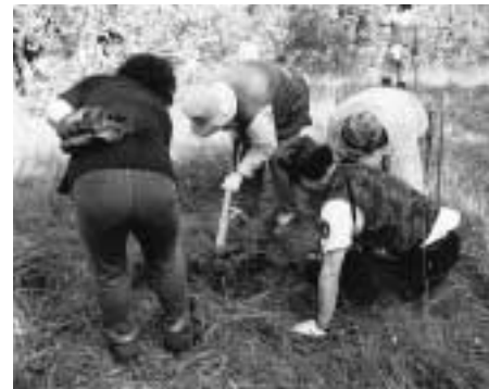
森からの自然の恵みを願い、開催中参加者によりミズナラ500本が植えられました。