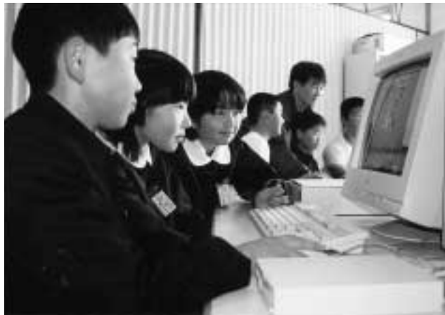
熊毛町立八代小学校内の緑の少年隊(山口県) 特別天然記念物「八代のナベツル」の保護活動の様子と、ツルの現状を全国に情報発信したいとの要請にパソコンを助成しました。