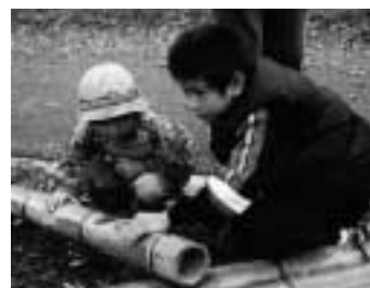
竹ボットで育て、ひとり立ちできるようにしたら、森に戻します。

国有林内の活動のため静岡森林管理署にご協力、樹木採取の許可をいただきながらの作業となりました。富士山ではよそから持ち込まれた植物は育たないため、台風による風倒被害の森から実生の稚樹や種子を採取して、自宅に持ち帰り育て、また富士山に植え戻す「里親植樹方式」が採用されています。このような活動は、「富士山森づくりプロジェクト」として継続して行われます。