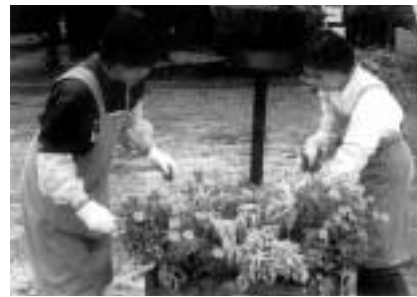
赤穂市緑化推進事業整備基金(兵庫県)赤穂城跡公園にフラワースタンドを設置。