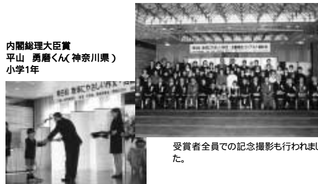
受賞者全員での記念撮影も行われました。