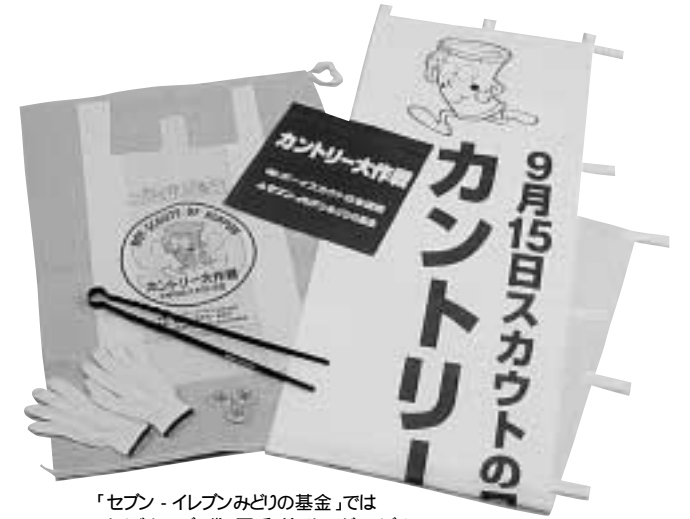
「セブン-イレブンみどりの基金」ではオリジナルゴミ袋、軍手、塗りトングのほり、参加記念バッジなどを提供し、活動を支援しました。