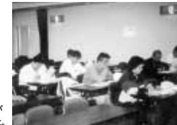
九州全県から14団体、33人が参加して行われました。

8回目となる「九州環境ボランティアネットワーク会議」今年は韓国釜山市から環境NPO代表3名が参加し、両国の抱える環境問題やクリーンアップについて意見交換されました。