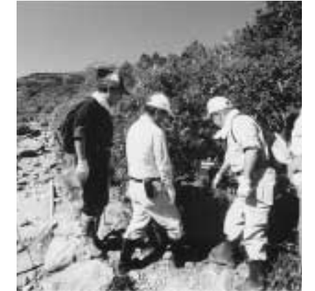
八方尾根自然環境保全協議会(長野県) 八方池汚濁防止や周辺の植生修復、グリーンパトロールなどを実施。中部山岳国立公園