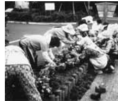
町田市花とみどりの会(東京都)市内3箇所の公共的な花壇に植花する「花とみどりの会」