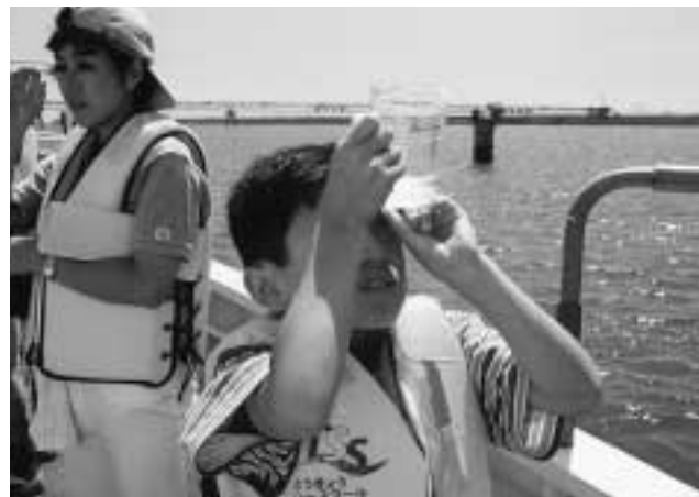
水温調査や海底のヘドロ、プランクトンの採取などが行われました。

東京湾で海洋調査などを通じ、汚染が心配される東京湾で息づく自然に出会い、海の自然の素晴らしさ・環境保全の大切さを考える体験航海「とうきょうシースクール」を設立から応援しました。プログラムに取り組んだ他、参加者全員に日常生活の中から出来ることを考えてもらうきっかけになるように、環境へやさしい生活チェック表の小冊子とセブン-イレブンみどりの基金のご案内パンフレットをお渡しました。