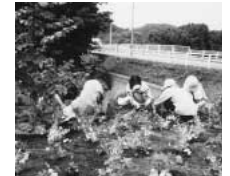
大和市みどり基金(神奈川県)市内6箇所にある花壇に植花を実施。