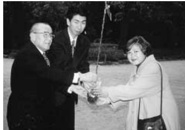
西宮りんご並木後援会(兵庫県) 阪神淡路大震災で失われた西宮市民の命の数だけリンゴの苗木を植え、追悼と緑豊かな新生西宮市の復興を願う活動を応援しました。