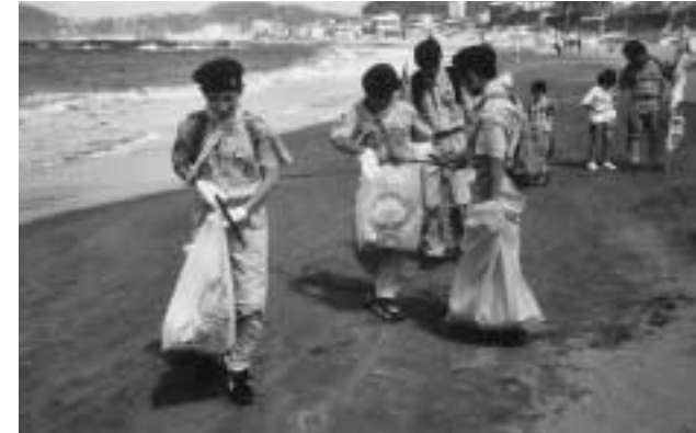
神奈川県 葉山第3団

今年も「9月15日スカウトの日・カントリー大作戦」の活動を支援。昨年を上回る、1,421団、64,267名が参加し、50万本以上の空缶を回収しました。