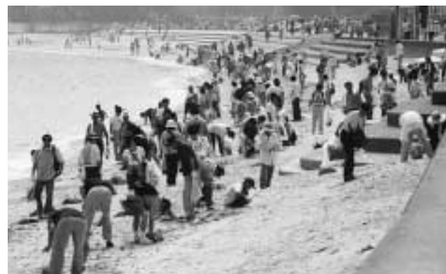
セブン・イレブンリーダー会場長垂海水浴場 2キロ程の海岸線を約700名が清掃活動。

九州地域一斉清掃活動のラブアースも今年で10回目を数えました。今年の実施状況は福岡市内35会場で30,960名が参加、回収されたごみは約143tでした。福岡市内を中心に、セブン・イレブン加盟店オーナー様と従業員の方131名が19会場に参加。セブン・イレブン・ジャパン社員115名も市民と一緒に清掃活動に汗を流しました。