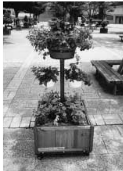
伊勢原市ふるさと森づくり基金(神奈川県)市の総合公園内、体育館前中央広場にフラワースタンドを設置。