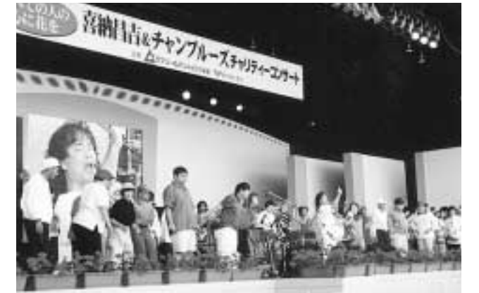
「すべての人の心に花を」をテーマにしたコンサート。