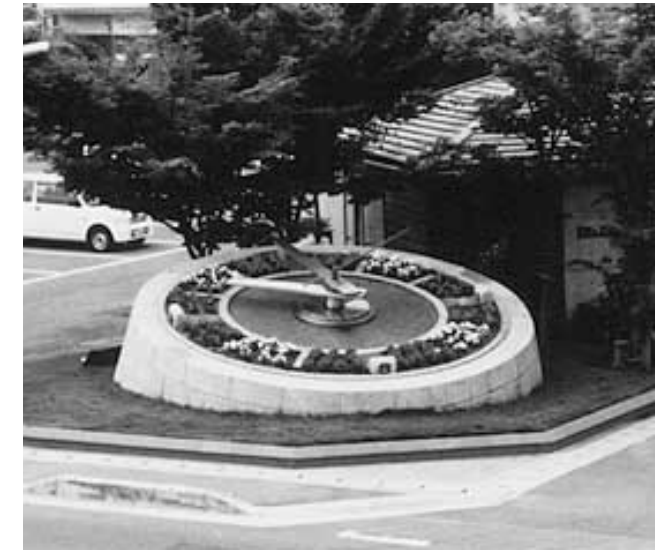
大野原町花いっぱい運動推進協議会(香川県)町内21箇所の花壇や設置されたプランターに植花。