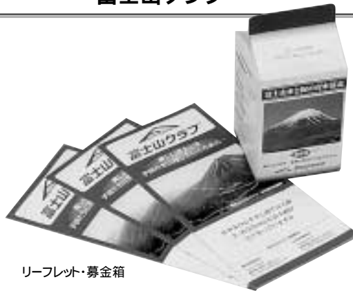
リーフレット・募金箱

富士山地域の環境活動を総合的・計画的・継続的に行っている市民団体「富士山クラブ」は、'99年11月NPO法人を取得。東京・三島・富士吉田の事務所を拠点に、市民・行政・企業との幅広いパートナーシップを目指し、ネットワークを構築しています。セブン・イレブンみどりの基金では、今後も富士山クラブの活動を支援していきます。