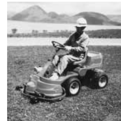
北海道の自然公園を美しくする会(北海道) 自然美豊かな観光地づくりのために、芝刈り機、スライバーを助成。支笏洞爺国立公園