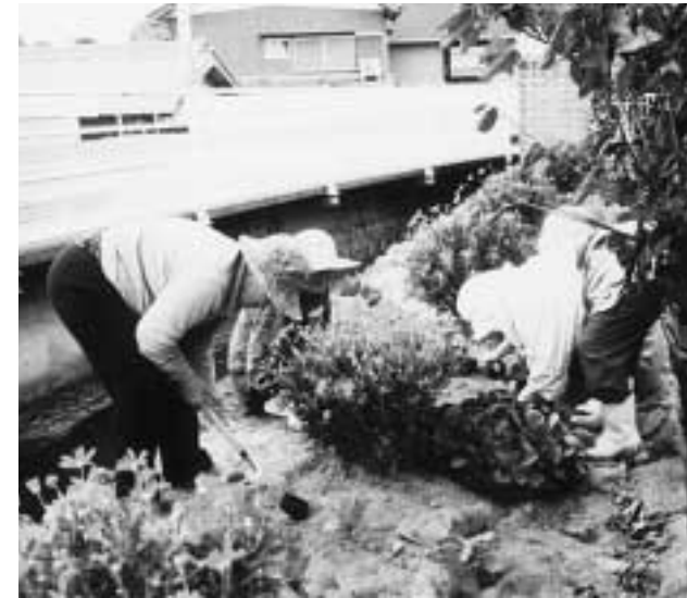
池田町花とふれあいの会(香川県)道路沿いの花壇に植花する「花とふれあいの会」