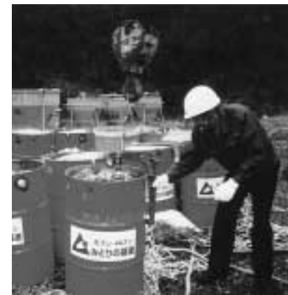
丹沢大山クリーンピア21(神奈川県) 山中のゴミをヘリコプターで搬出後、トラックで指定のゴミ処理場まで運搬。丹沢大山国定公園