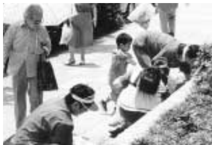
若宮大路グリーンクリーン運動(神奈川県) 鎌倉のメインロード、若宮大路の清掃活動が実施されました。