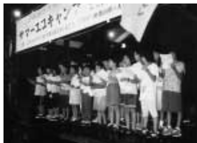
キャンプ生活で出たごみの調査や、マナー向上クイズ作戦などが実施されました。

昨年に引き続き、環境庁主催の「こどもエコクラブ全国交流会」の交流・情報交換を目的としたサマーキャンプを応援。和歌山県西牟婁郡大塔村百間山溪谷キャンプ村を会場に、自然探検・交流会等を行いました。