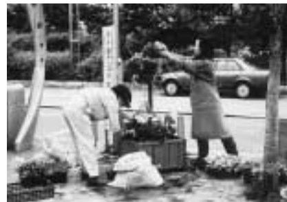
清瀬市緑地保全基金(東京都)清瀬駅北口駅前広場にフラワースタンドを設置。