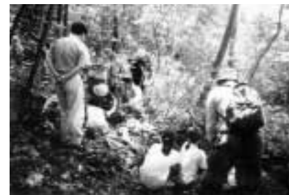
エコトピア上越(新潟県) 里山としての市民の森公園の整備事業を応援。雑木林の間伐作業を支援しました。