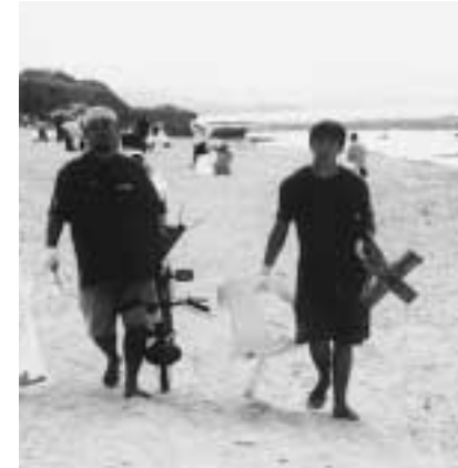
沖縄国際ビーチクリーンアップ(沖縄県) ゴミを拾うだけでなく、分析し行政に報告。散乱防止に役立っています。沖縄県における国立・国定公園全域