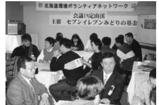
日頃の活動の知恵とノウハウを元にさまざまな角度から出た意見がテーマ別にまとめられました。