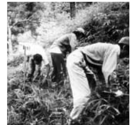
里山倶楽部(大阪府) 里山の雑木林の手入れや苗木の植栽、炭焼き等への参加を府民に呼びかけました。金剛生駒紀泉国定公園