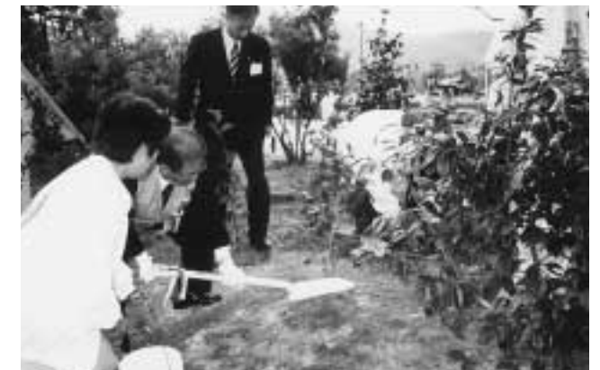
日韓の環境協同保護合意を記念して釜山市の花、ツバキを植樹。