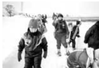
音更川グラウンドワーク研究会(北海道) 身近な地域で環境を考える活動を支援。かんしきをはいて、雪原自然観察会を実施しました。