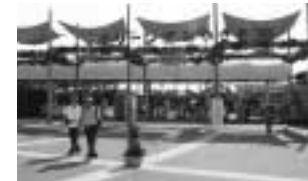
フェア中入場者は190万人を超えました。

第16回全国緑化フェアにおいて、セブン-イレブンみどりの基金主催により、喜納昌吉&チャンブルズのチャリティーコンサートを開催。宮崎県内の障害者作業所の皆様とご家族を招待し、会場の花とみどりを楽しんでいただきました。また、会場に訪れた800名の方に、母の日にちなんでカーネーションの花の苗をプレゼントしました。