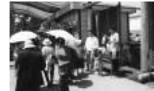
カーネーションの花の苗を配布。