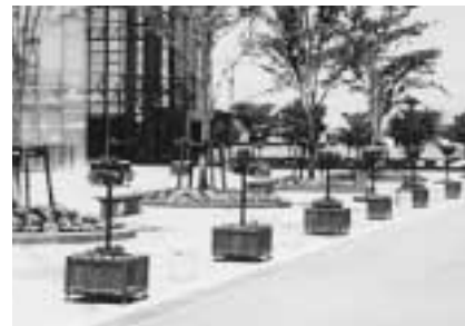
松任市緑と花の基金(石川県)市役所と交流センターの間の広場に緑と花のプロムナードとなるよう設置。