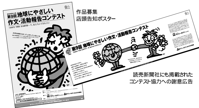
読売新聞社にも掲載されたコンテスト協力への謝意広告

上位入賞作品は、インターネットのホームページ http://www.net-wave.com/sakubun/ でご覧いただけます。