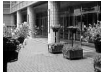
平塚市みどり基金(神奈川県)平塚市体育館前にフラワースタンドを設置。