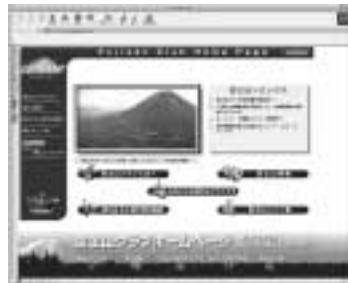
ホームページを通じて世界へ富士山の情報を発信しています。http://www.fujisan.or.jp