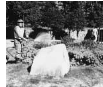
(財)木津町公園都市緑化協会(京都府)町内4箇所にある花壇に植花を実施。