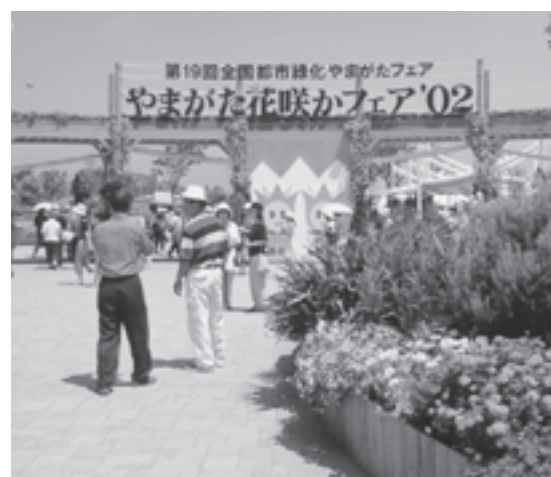
花と緑にあふれる会場内