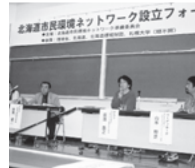
北海道市民環境ネットワーク(北海道) ボランティア団体の基盤を強化し、より効果的な活動ができるようなネットワークの構築を目指し、平成10年度より取り組んできた北海道ボランティアネットワーク事業が組織として設立されました。

環境ボランティアが、地域のために何ができるのか、何が必要なのかを情報交換し、地域のボランティア団体のネットワーク構築を目指し、地域で市民活動を支えるための市民による会議が今年度北海道と九州で開催されました。