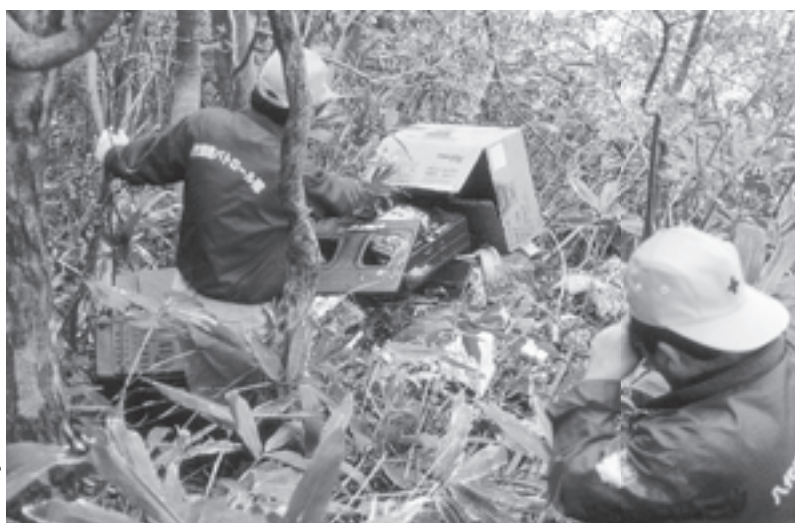
八代環境パトロール隊(富山県) 山中で行う不法投棄などのパトロールを実施。活動中の事故への対応のため、連絡に必要な備品を助成しました。