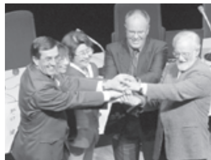
NPO法人 富士山クラブ (富士山地域) 2月23日富士山の日「国際シンポジウム」海外のコニーデ型火山で活躍する環境ボランティアとの交流を目指し、アメリカのレーニア山、ニュージーランドのナウルホエ山と姉妹山の調印。