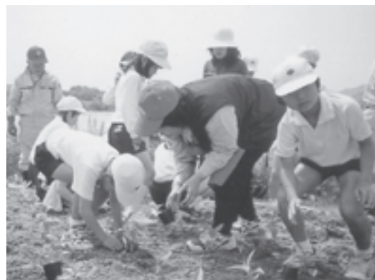
AGN揖保川ランチ(兵庫県) 四季の移り変わりが感じられ、地域の人に親しまれる揖保川河川敷でのせせらぎ公園花壇づくり活動に、花苗を助成しました。