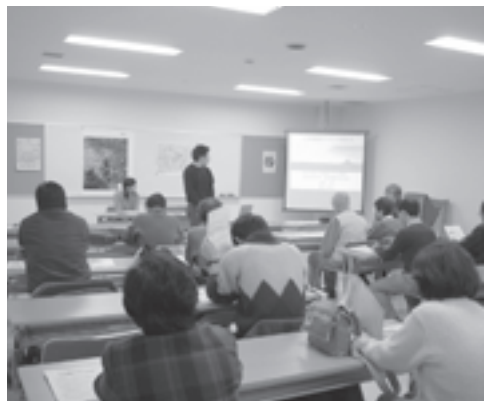
環境広場(北海道) 江別市内の小学校で実施された、身近な自然環境調査アンケートをまとめた報告書の製作費などを助成しました。

環境をテーマに共通の目的をもった地域の市民・企業・行政がパートナーシップを組み、市民が主体となったまちづくり、地域づくりを行う環境市民ボランティア団体を応援しています。