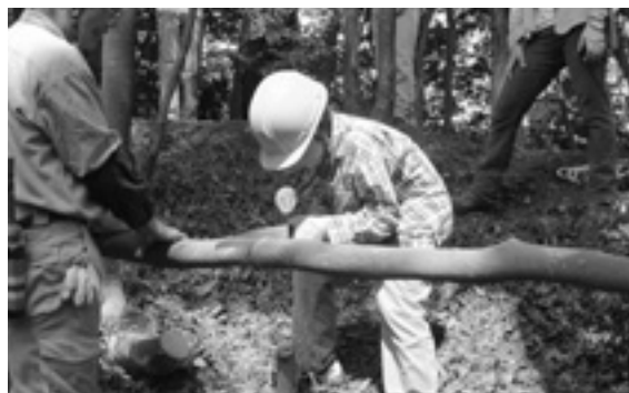
山城町「サンフォレスター」(京都府) 里山の植生を守るため、立ち枯れたアカマツやスギ、ヒノキなどの人工林伐採を行う活動に、チェーンソーなどの道具を助成しました。