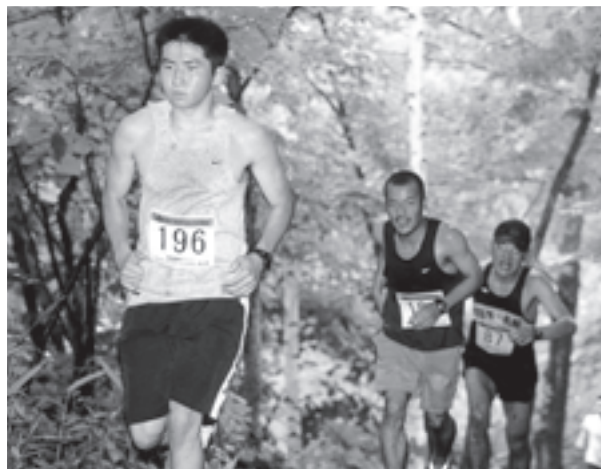
「北海道森林マラソン・トレイルフェスティバル2002」 札幌市の水がめ、奥定山溪国有林で開催。今年で4回目となるこのイベントに、雨天にもかかわらず1072名もの競技者が参加しました。

市民に開かれた国有林で森林マラソン、ウォーキングなどのエコスポーツを楽しみながら、自然の大切さを体感できる森林マラソン。家庭に持ち帰り、苗木を育ててもらふコーナーや巨木の観察会など、応援に来られた方も森に親しめるイベントとして開催され、また参加費の一部は地域の森づくりに役立てられています。