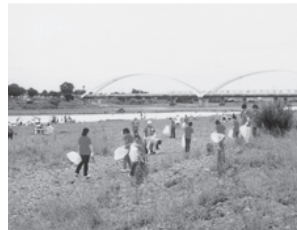
相模川鮎津橋会場(神奈川県)

セブン-イレブン加盟店と本部が一体となって地域の散在性のごみ問題に取り組む「セブン-イレブンデー全国一斉清掃活動」。年2回、7月と11月に行っているこの活動へ、セブン-イレブンみどりの基金はペットボトル再生素材100%のロゴ入りオリジナル軍手などを提供し、その活動を応援しています。平成14年度はのべ約4万6000人が参加し約109トンのごみが回収されました。