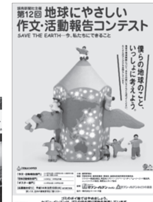
作品募集店頭告知ポスター