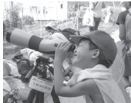
生駒の自然を愛する会(奈良県) 身近に存在する自然に直接ふれることで、こどもたちの環境意識を育てる「自然観察会」。観察を行うために必要なフィールドスコープなどを助成しました。