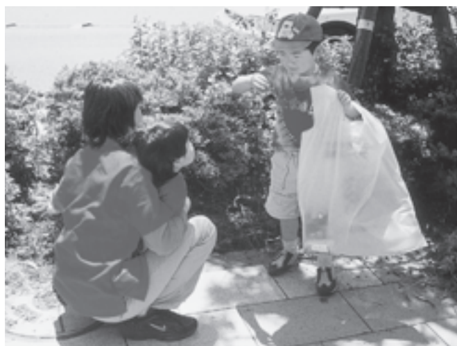
NPO法人 かまくら緑の会(神奈川県) 鎌倉市若宮大路で行われる清掃活動に清掃器具などを助成しました。鎌倉市内のセブン-イレブン加盟店も参加し、市民の方と一緒に清掃活動を行いました。