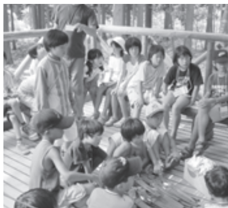
やまばの会 (滋賀県) 里山保全活動「やまばの森づくり」に必要なチェーンソーを助成。たくさんの方が自由に里山を利用できるように活動を応援しました。