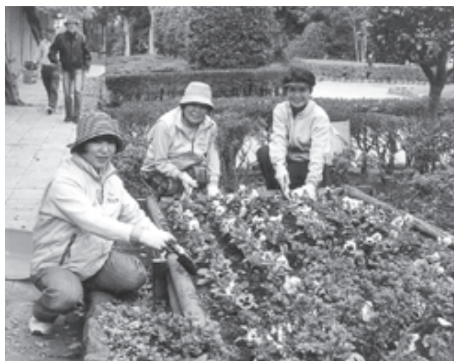
新林公園愛護会(神奈川県) 地域に親しまれる新林公園を彩る花壇の花苗や肥料を助成しました。