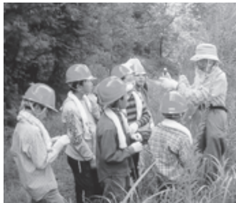
わいわいクラブ(福岡県) 里山の保全作業や農作業体験を通じて世代を超えた交流の場をつくり、ジュニアボランティアを育成する活動に必要なヘルメットなどを助成しました。