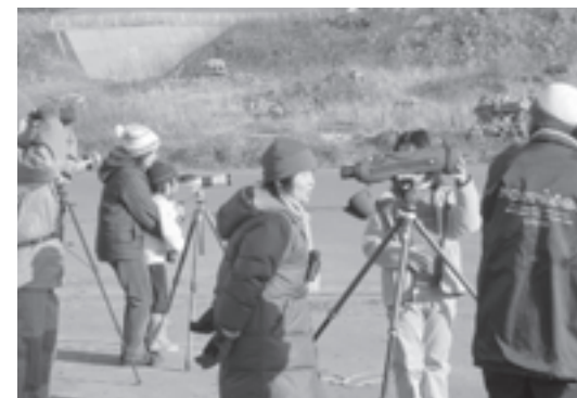
知床海鳥研究会(北海道) 知床半島における「絶滅危惧種ケイマフリ」の生息・繁殖分布に関する海上からの調査に必要な船舶にかかる経費を助成しました。