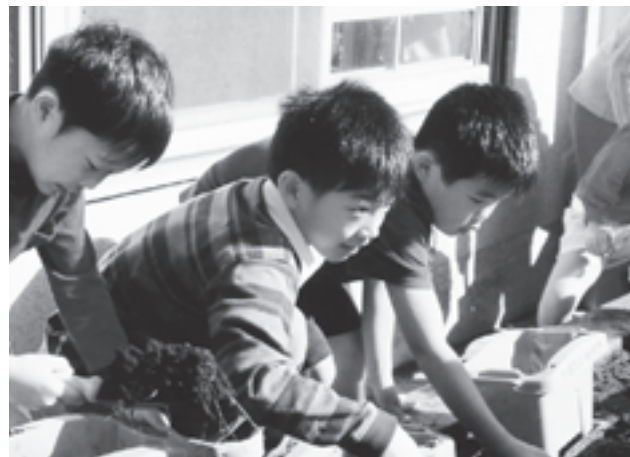
NPO法人 緑のごみ銀行(東京都) 土がやせ元気がない都会の緑に元気を取り戻すため、地域の生ごみや落葉でたい肥や腐葉土をつくる活動に、コンポストなどを助成しました。