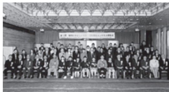
12月に東京で行われた表彰式

「地球を救うために、いま私たちができること」をテーマにそのアイデアと実践例を発表してもらうこのコンテストに、今年は世界23カ国の6歳から94歳まで2万9945点もの応募が寄せられました。今年度より中学生の部にポスター部門が新設され、より多くの方が参加する機会となりました。