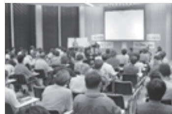
富士山地域保全支援プラン コウモリの会 コウモリと富士山麓の自然を通して、人と自然の関係について考える「第8回コウモリフェスタ in 富士山」の開催を応援。