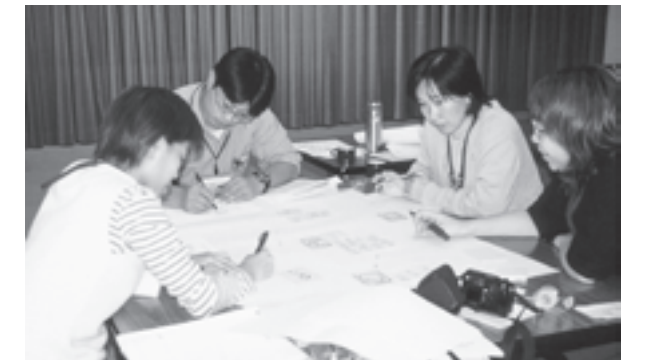
平成14年11月2日～3日 海外ボランティアリーダー海外研修の派遣者を中心に15名が参加。