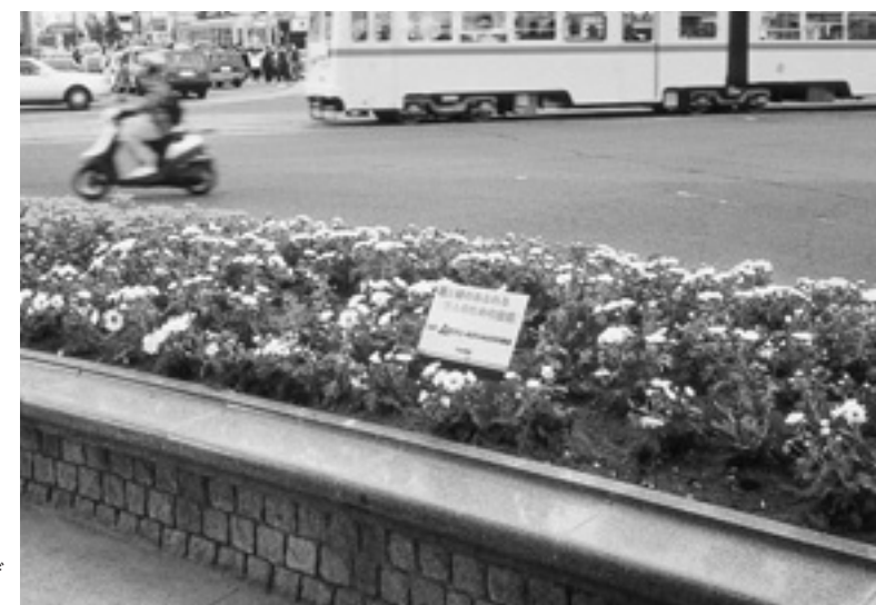
プレートメッセージ 「花と緑あふれる万人のための故郷」と、原爆投下後の広島が現在の復興をとげた想いを込めました。

広島市の“花と緑のあふれるまちづくり”を目指す、「グリーンパートナーモデル事業」の趣旨に賛同し、広島市中区八丁堀交差点、JR広島駅南口など計4か所に「パートナー花壇」を出展しました。