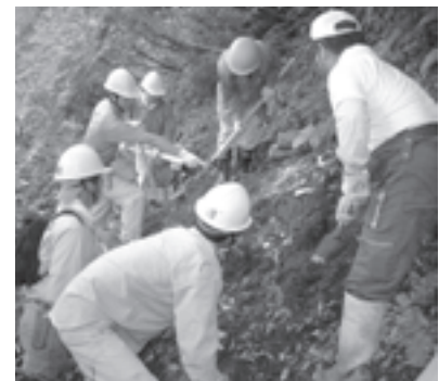
おうせん 嬭仙の滝のカツラ保全協議会 (群馬県) 草津町にあるカツラの巨木を保護するため、ガイドロープの設置や遊歩道を整備する費用を助成しました。

地元ボランティア団体などとパートナーシップを組み、自然との共生を考える教育の場として、環境指標植物である「巨樹・巨木」を中心とした豊かな生態系を保護する活動を平成12年度より継続して行っております。今年度は5ヵ所の保護活動を応援しました。