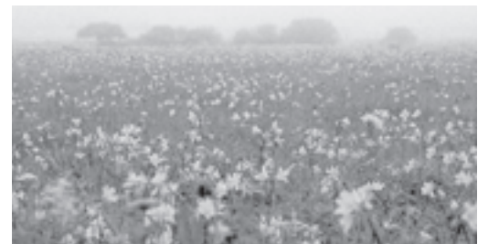
霧多布湿原は日本最大級の原生花園