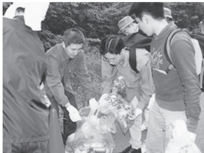
富士山クリーン大作戦 (富士山地域) 今年で6回目となる「富士山クリーン大作戦」。セブン-イレブン社員のボランティア体験活動として、社員約100名が参加し青木ヶ原樹海の県道沿いで実施されました。

セブン-イレブンみどりの基金は、総合的、計画的、継続的に富士山地域の環境活動を行っている「NPO法人 富士山クラブ」をパートナーに、さまざまな環境活動に取り組んでいます。また、「富士山環境保全支援プラン助成制度」に基づき、富士山地域が抱える環境問題に対し、調査、研究や実践的な活動を行っている10団体2個人の活動を支援しました。