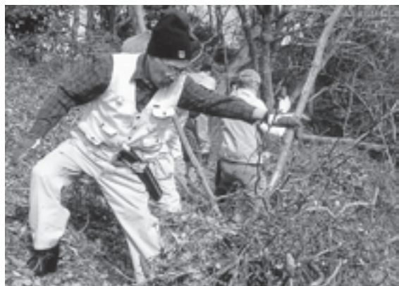
TEAM FOREST FREAK (神奈川県) 雑木林を守るため、放置された造成地を整備し落葉樹を植樹する市民参加の森林レスキュー作戦にチェーンソーなどの道具を助成しました。