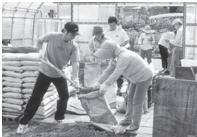
NPO法人 かわだ夢グリーン(福井県) 地域の生ごみのリサイクル施設「ザ・リサイクル工房」内での生ごみたい肥運搬作業。良質なたい肥を果樹栽培に利用しているリサイクル活動費を助成しました。