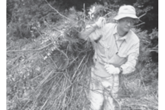
ヒヨウモンモドキ保護の会(広島県) 「絶滅危惧種ヒヨウモンモドキ」を中心とした湿地の動植物保護活動に助成を行いました。