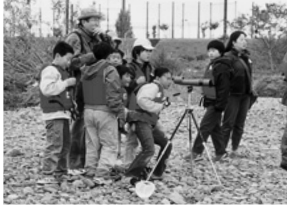
かわさき水辺の楽校等々力校 (神奈川県) 川の浅瀬に入り、深さ・温度・水質を身をもって体験する環境学習。河川などの観察中、安全確保に必要なライフジャケットを助成しました。

次世代を担うこどもたちの環境意識を育てる、体験型環境学習を行っている環境市民ボランティア活動を支援しています。また、今年で9回目を数えるスカウトによる「カントリー大作戦」への活動支援も行いました。