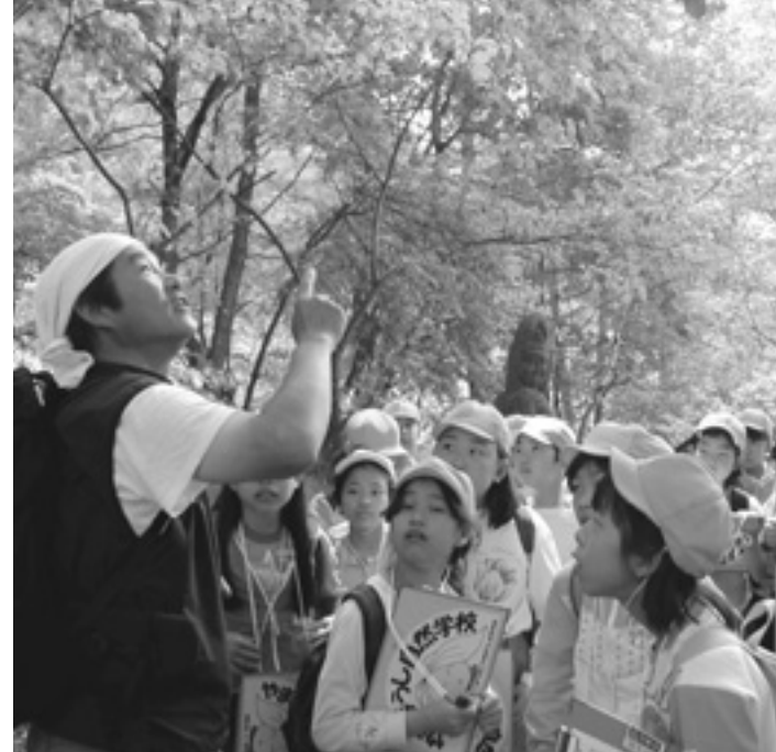
NPO法人 やまぼうし自然学校 (長野県) 森に入り森林ボランティアを体験し、間伐材の有効利用を学ぶ森林環境学習に必要な TENT などの道具類を助成しました。