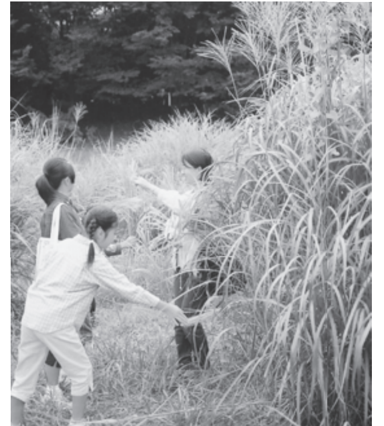
NPO法人 生態工房(東京都) 多様な草原植物が生息するスキの原っぱ、「絶滅危惧種フジバカマ」の保全活動のために必要な草刈り機やチェーンソーなどを助成しました。