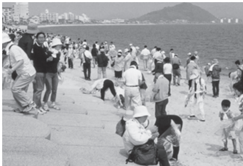
NPO法人 NPOクリーンふくおかの会(福岡県) 九州地区を中心に実施されている海岸一斉清掃活動「ラブアース・クリーンアップ」。参加した福岡市民約2万8300人と一緒にセブン-イレブン加盟店オーナーとその家族、従業員、社員約100名も参加し、清掃活動を行いました。

ごみのない花と緑のあふれる美しいまちづくりを目指して、美化活動を行う市民の方や環境市民ボランティア団体を応援しています。札幌大通公園に続き今年度より広島市内にも花壇を出展しました。また、セブン-イレブン加盟店と本部が一体となって取り組む「セブン-イレブンデー全国一斉清掃活動」への支援も行ってまいります。