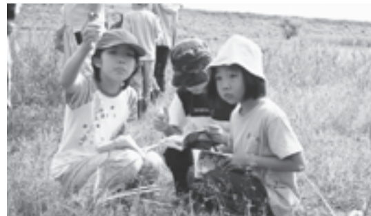
NPO法人 グランドワーク西神楽(北海道) 住民に親しまれる「さと川づくり事業」を市民と行政がパートナーシップを組み推進。活動案内のチラシ製作費などを助成しました。