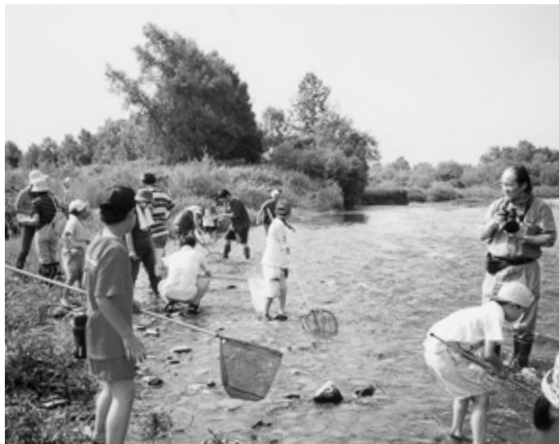
音更川グラウンドワーク研究会(北海道) 地域の市民、企業、行政がパートナーとして音更川河川敷に自然そのままの「あそび場」をつくる活動に対し助成を行いました。