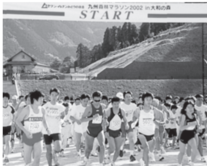
「九州森林マラソン2002 in 大和の森」 樹齢2000年を超える杉の巨木が点在している福岡県の若杉国有林で行われ、約620名が参加。九州地区では今年初めての開催となりました。