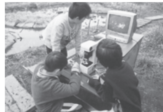
鳩ヶ谷にトンボ公園を作る会(埼玉) 休耕地を利用して「絶滅危惧種メダカ」の保護繁殖を行うビオトープ池の水質保持のため、水循環用のパイプ提供などを行い池の水質強化事業を応援しました。