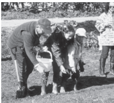
NPO法人 白神山地を守る会 (青森県) 赤石川奥山のブナの森復元に必要な苗木を同じ森の種から育てる活動に耕耘機を助成しました。