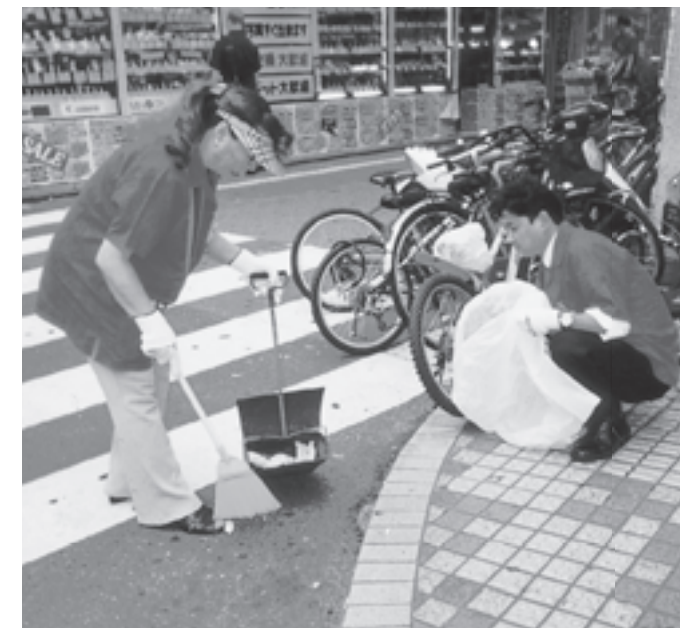
JR蒲田駅前会場(東京都)