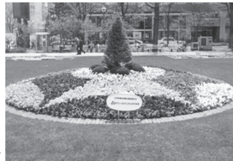
セブン-イレブンみどりの基金花壇は、大通4丁目東側にあります。

市民や札幌を訪れる観光客の心のオアシスとなっている「札幌大通公園花壇」。セブン-イレブンみどりの基金は、平成9年度より出展し、年間を通して維持管理しています。