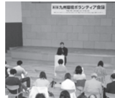
九州環境ボランティア会議(九州) 九州地域の草の根活動の交流を中心としながら、環境ボランティア活動の具体的な推進をテーマに開催された九州環境ボランティア会議。九州地区でのボランティアネットワークの支援は平成8年度から継続されています。