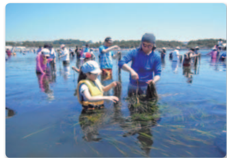
アマモの花枝の採集

6月14日神奈川県横浜市「横浜海の公園」で、セブンイレブン加盟店オーナーや本部社員など66名のボランティアが、腰まで海につかりアマモの花枝を採集しました。