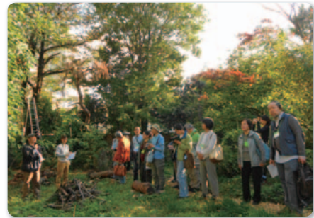
フィールドサロン

2014年度は、「東京の緑を守ろうプロジェクト助成」を行うと共に、「東京の緑を守る将来会議」と共催で10月13日に「みどりのまちづくり in Tokyo 2014」を、11月3日に「みどりのコトはじめフィールドサロン」を開催しました。