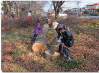
NPO法人 九州バイオマスフォーラム (熊本県)

市民団体の森林の保護・保全を通じたCO 2 削減活動を支援する「地球温暖化対策助成」では、2014年度の助成先3件と2013年度からの継続助成先10件を合わせ、13件に1539万2757円の助成を行いました。