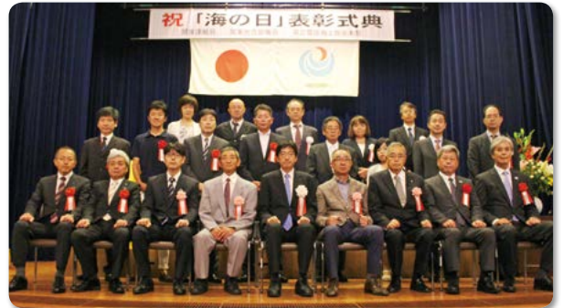
神奈川県横浜市開校記念会館講堂の第22回「海の日」表彰式典

セブン-イレブン記念財団は、2011年から水質浄化やCO 2 削減に役立つアマモを増やして、東京湾を豊かな海に再生する活動「東京湾UMIプロジェクト」に取り組んでいます。7月21日、「アマモ場の育成活動を通じて東京湾における環境の再生と環境改善の意識向上に大きく貢献されました」と、国土交通省関東整備局長から海事関係功労者表彰港湾空湾功労(振興発展)に表彰されました。