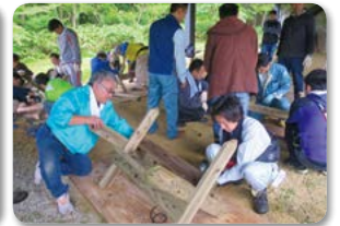
10月3日「長野セブンの森」では、大山桜植樹と間伐材のテーブルとベンチづくり