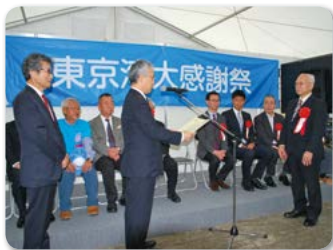
横浜港・横浜赤レンガ倉庫の「東京湾大感謝祭2017」表彰式

10月21日、「東京湾再生官民連携フォーラム」を2013年度の設立時より支援していることに対し、「東京湾の海の環境に係る普及啓発活動を多年にわたり行い豊かな東京湾の環境を次世代に引継ぐための活動の発展に大きく寄与されました」と、「東京湾海の環境再生賞」国土交通大臣賞が授与されました。