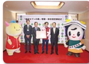
11月1日「福井セブンの森」調印式

「セブンの森」づくりは、新たに「長野セブンの森Ⅱ」と「福井セブンの森」を協定期間10年としてスタートさせ、全国19カ所となりました。「長野セブンの森」は、長野県上水内郡信濃町と協定を結び「やすらぎの森」で、「福井セブンの森」は、福井県と福井市、セブン-イレブン記念財団の三者間で協定を結び、福井市小羽町の市有地「清水きららの森～おばやま自然公園～」で森づくりを行います。