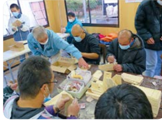
募金箱は宮城県大崎市の障害者就労支援事業所で組み立てています