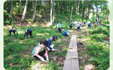
ホタル再生を目指す河畔林の保全 「茨城セブンの森」