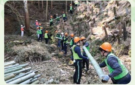
森林の再生「佐賀セブンの森」