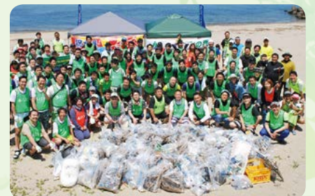
海の再生活動「阪南セブンの海の森」