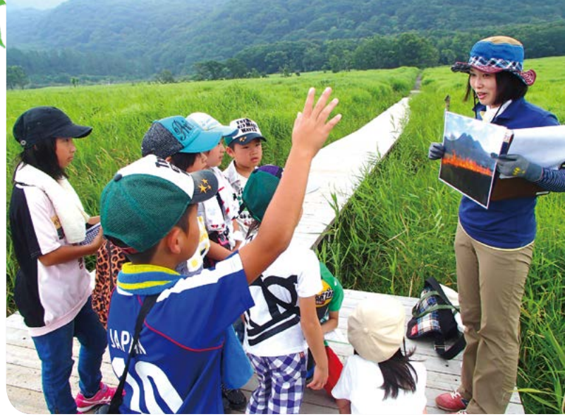
九重ふるさと自然学校

日本の四季折々の美しい自然や貴重な生態系を次世代に受け継いでいくために、様々な団体と協力して保護・保全活動を推進するとともに、自然学校を運営しています。