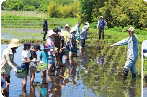
親子で田植え体験

九重ふるさと自然学校は、2007年に開校し、ラムサール条約に登録された「くじゅう坊ガツル・タデ原湿原」をはじめとする草原環境の保全や草原性チョウの保全活動、さらにお米も生きものも育む自然共生型の田んぼづくりや地域に根付く伝統野菜の普及・啓発を通して、人と自然が共生する里地里山の保護・保全活動に取り組んでいます。