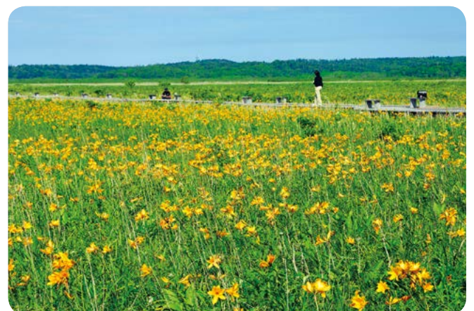
霧多布湿原はラムサール条約登録湿地