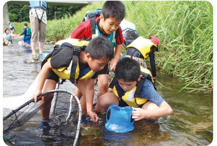
川の生きものしらべ

「生きもの育む自然共生型田んぼづくり」は、国連生物多様性の10年日本委員会連携事業に認定されています。また、行政と連携し、各種の調査も実施しています。