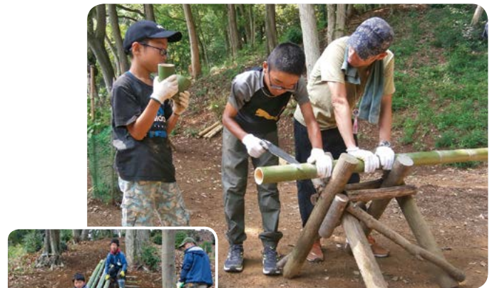
クラフトワークショップ

重要性を体験し学ぶとともに、地域の自然、歴史、文化などを次世代に継承していく人材を育てます。