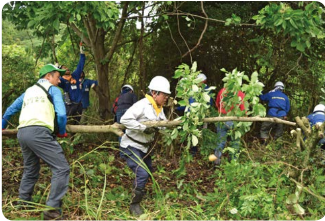
「高尾セブンの森」森林整備

2006年に「支笏湖セブンの森」をスタートさせて以来、全国で「セブンの森」づくりに取り組んでいます。2014年からは、「セブンの森」の間伐材を利用した木製募金箱を店頭で設置し、木材を循環させていくことで森林保全と地球温暖化防止につながっています。