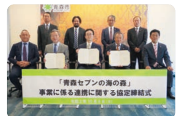
2021年10月9日 「青森セブンの海の森」協定式記念写真