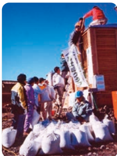
富士山山頂バイオトイレ 杉チップ投入