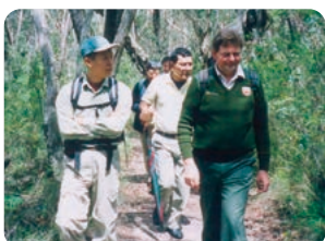
2002年2月 第1回海外研修オーストラリア