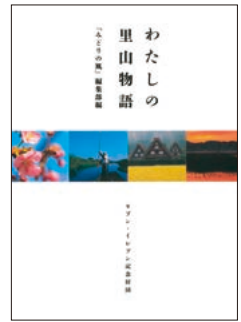
20周年記念誌 「わたしの里山物語」発行