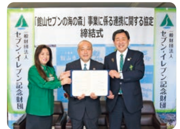
2021年3月24日 「館山セブンの海の森」協定式記念写真