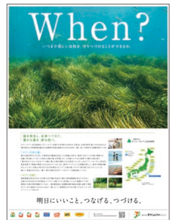
日本経済新聞(2021年7月7日)掲載