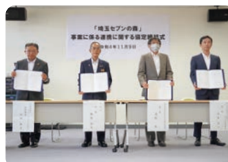
2022年11月9日 「埼玉セブンの森」協定式記念写真