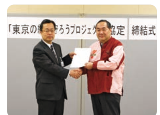
2010年2月17日「東京の緑を守ろうプロジェクト」に関する協定締結式