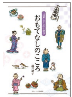
『「江戸しぐさ」に学ぶ おもてなしのこころ』発行