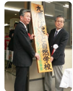
2007年4月21日 九重ふるさと自然学校開校