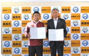
2018年6月1日「阪南セブンの海の森」 大阪府大阪市と調印