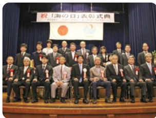
2017年7月21日 海事関係功労者 表彰港湾空湾功労(振興発展)に表彰