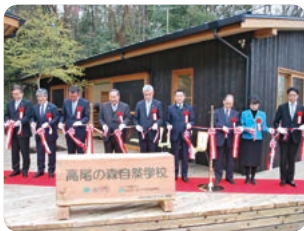
2015年4月10日 高尾の森自然学校開校