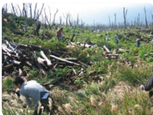
2008年11月1日 第1回「三宅島緑化プロジェクト」