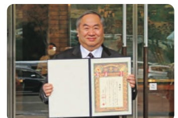
2022年11月26日 ボーイスカウト日本連盟創立100周年記念式典にて