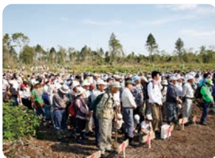
2006年9月17日第1回のメインデーには1,225名の市民が参加