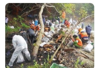
2011年6月11日 第1回「東日本大震災復興プロジェクト」