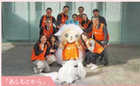
「あしもとから」 毎月15日(5×3=15)に自分達のあしもとから 出来ることを実践する日