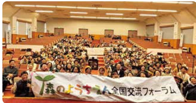
第20回 森のようちえん 全国交流フォーラム in 青森

森の中を学びの場として、子どもの主体性を重んじた保育を行う森のようちえん活動の関係者が集い、情報交換をするフォーラムに2015年の第11回より特別協賛しています。