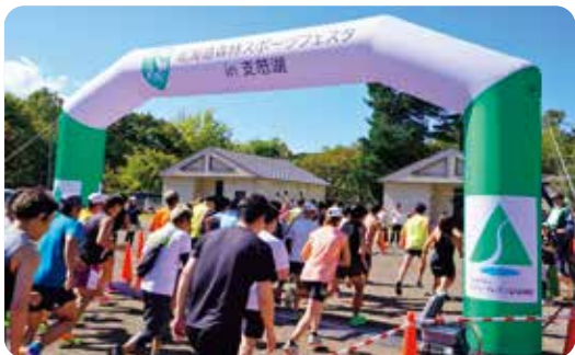
第24回 北海道森林スポーツフェスタ 2025 in 支笏湖

森林の中で行われるエコスポーツを通して、森の恵みやすばらしさを体感する「北海道森林スポーツフェスタ」に1999年の第2回より特別協賛しています。