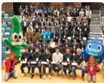
海辺の自然再生・高校生サミット2025 in よこすか

全国の高校生たちがアマモを中心とした海に関する研究発表をする「海辺の自然再生・高校生サミット」の開催を第1回から支援しています。