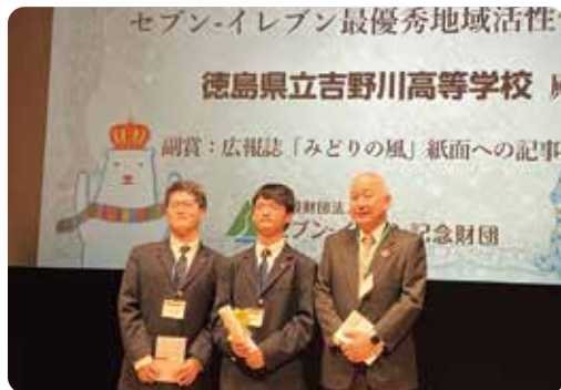
脱炭素チャレンジカップ2026 セブン-イレブン記念財団 最優秀地域活性化賞 受賞 徳島県吉野川高等学校

日本全国、多様な主体が取り組む脱炭素化に関する活動を表彰する制度を通じ、全国の優れた取り組みのノウハウや情報を共有し、さらなる活動への連携や意欲を創出するしくみと場である「脱炭素チャレンジカップ」を(一社)地球温暖化防止全国ネットと2012年から共催しています。