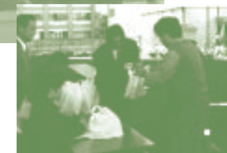
身近に花を育て花や緑の大切さを感じてもらおうと、コンサート来場者にテルスター800苗をプレゼントしました。