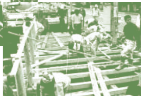
「三島ゆうすい会」(静岡県) 三島梅花藻の里整備事業