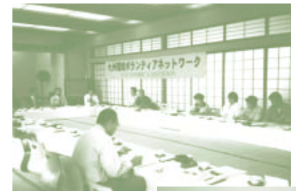
九州各地で活躍するボランティア団体が一堂に会した「九州環境ボランティアネットワーク会議」

ボランティア間の情報の共有化を図ろうと「クリーンふくおかの会」の提唱で九州各地で活動するボランティア団体が集まり、ネットワーク会議を開催しています。セブン-イレブンみどりの基金では、この「ネットワークづくり」に支援しています。また、年2回行われた会議では12の団体が参加し散乱ゴミ調査、各県での酸性雨調査などの報告もあり、活発な意見交換が行われました。