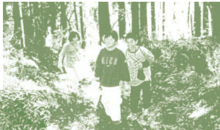
「安塚町役場(新潟県) 雪のふるさとやすづか「まちの宝物」ウォッチング

市民・行政・企業が協力して地域環境改善活動を推進するグラウンドワーク活動。遊休地を利用したの公園づくりや、森の保全作業、水質汚染の改善作業、花壇の作成など、各団体が地域のすこやかな環境づくりを目指してさまざまな活動に取り組んでいます。