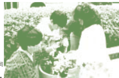
「福岡市都市緑化基金」(福岡県) 大博通りにおける植花