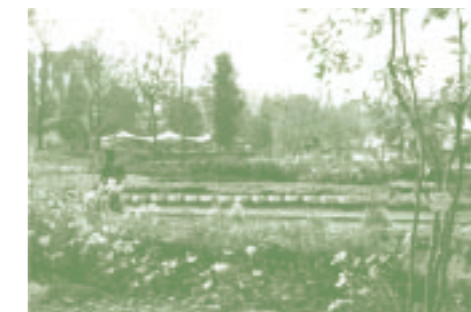
緑と花がいっぱいの会場風景