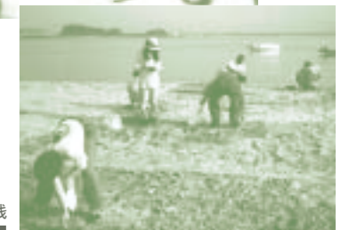
散乱ゴミ調査の実践