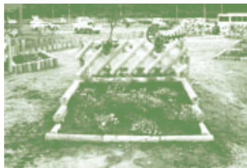
「朝日町まちづくり円卓会議」(北海道) 「ワン・デイ・チャレンジ」ポケットパーク造成事業