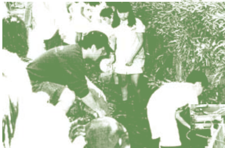
「明治用水緑道と水利用協議会」(愛知県) 明治用水緑道せせらぎ環境整備事業