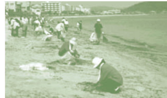
■今宿長垂海水浴場での清掃活動(福岡県)

「クリーンふくおかの会」をはじめとするボランティア団体や九州地区の市民と行政が一体となり、今年で6回目となる一斉清掃活動が6月1日に実施されました。活動エリアも九州各県から山口県下関市、大韓民国南岸にまで広がり、約60万人が参加しました。今宿長垂海水浴場ではセブン-イレブンの社員がリーダーを務め、オーナー様・従業員の方々、社員とその家族も参加し、海岸線を中心としたゴミ回収作業に取り組みました。