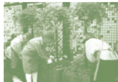
「大宮市花とみどりの基金」(埼玉県) 指扇駅前に10基のフラワー

一般公募「緑と花のスポットガーデン」の活動助成 (財)都市緑化基金を通じて一般公募した全国各地のさまざまな活動を応援しました。(平成9年度 助成実績11件)