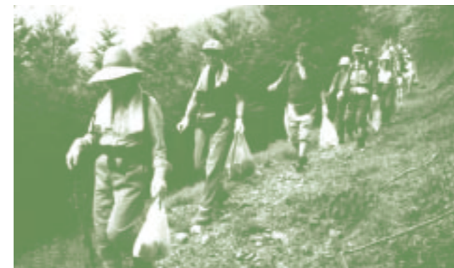
「東京都勤労者山岳連盟」(東京都) 清掃活動を行う「むらやま山の会」

勤労者の登山愛好家の団体、東京都勤労者山岳連盟が6月1日に行った「清掃登山 奥多摩・高尾クリーンハイク」に、水質検査・岩場や崖の清掃を行う備品を提供。みどり豊かな山岳自然をいつまでも残したいと願う連盟の活動をバックアップしました。