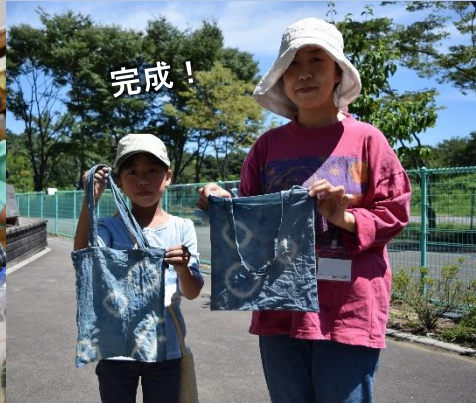
手ぬぐいに色づけ